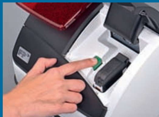
HILFSBEREIT: Über das Display (Foto oben) werden alle notwendigen Schritte, wie beispielsweise beim Kassettenwechsel, erklärt.

In der Tat, auch im FACTS-Test machte die PostBase Mini eine gute Figur. Als Erstes überzeugte sie in Sachen Bedienung und Handhabung, denn der neue junge FACTS-Mitarbeiter, der nie eine Frankiermaschine bedient hatte, kam in kürzester Zeit mit dem Frankiersystem klar.