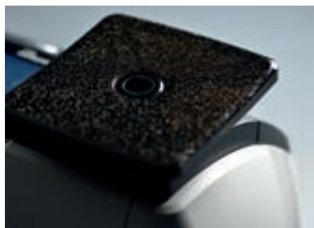
HIGHLIGHTS: Der Wiegeteller (Foto links) ist in verschiedenen Farben erhältlich. Die PostBase Mini ist mit Anschlüssen für den PC und für das Netzwerk ausgestattet (Foto rechts).

Der Grund dafür ist das 3,5 Zoll große Farb-Touchdisplay, über das sowohl die Ersteinrichtung, die im Test nur wenige Minuten dauerte, als auch das Frankieren intuitiv möglich sind.